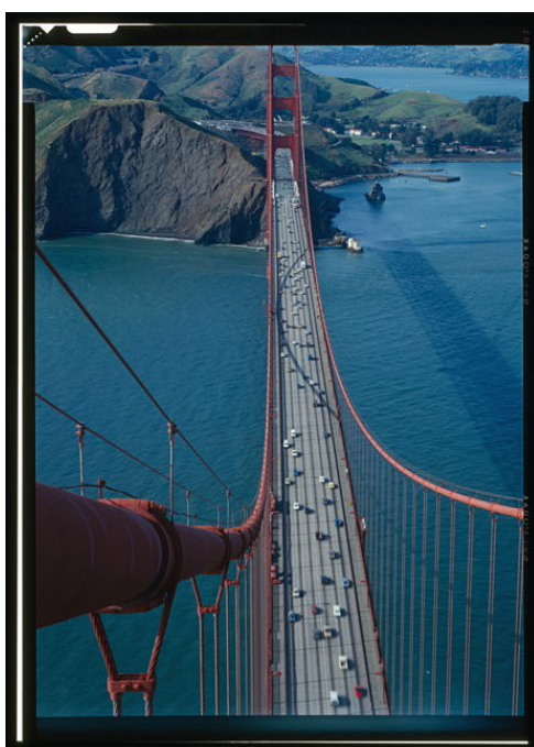
General View from Top of Southern Tower, Looking North, Jet Lowe, 1984

(maquette, horaires, salles, programmes, modalités d'évaluation)