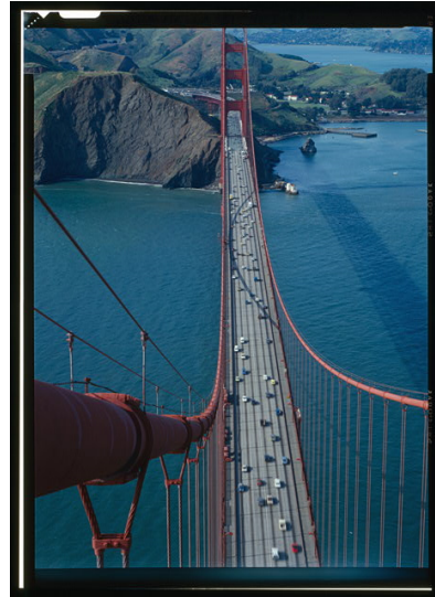
General View from Top of Southern Tower, Looking North, Jet Lowe, 1984